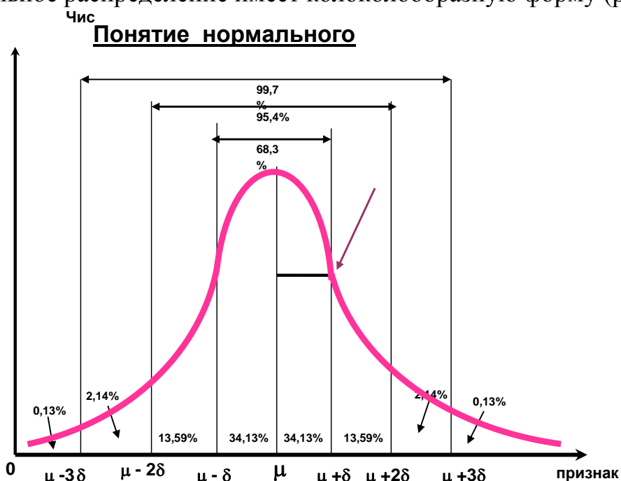
Рис. Кривая нормального распределения К.Гаусса

Нормальное распределение имеет колоколообразную форму (рис. 1).